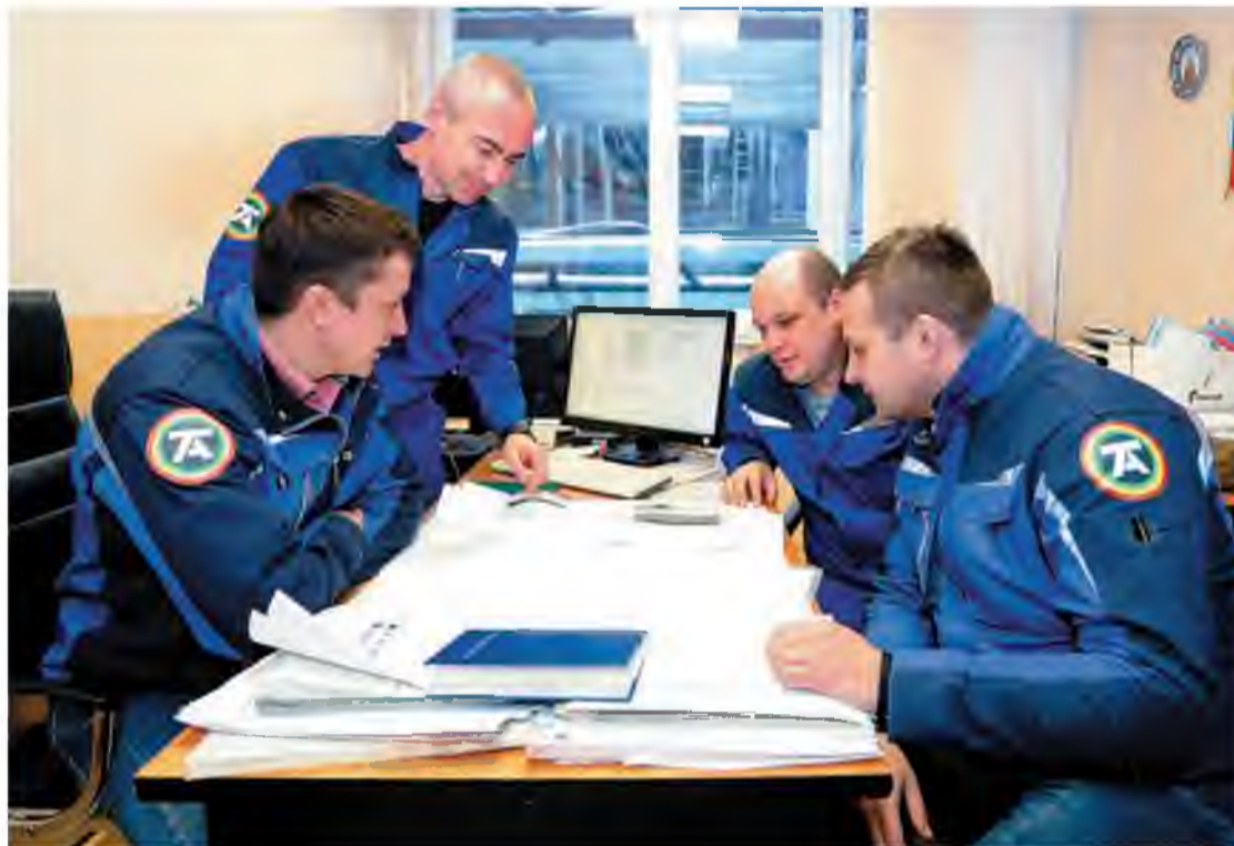
Наша задача –

Служба заказчика будет следить за исправным состоянием оборудования на агрегатах, контролировать своевременное заключение договоров на поставку нового, услуг ремонта и диагностики, сроки и качество выполнения работ ремонтными цехами завода и подрядчиками. Специалисты службы организуют управление аварийным запасом и подменным фондом, чтобы обеспечить бесперебойную работу оборудования. И, конечно,