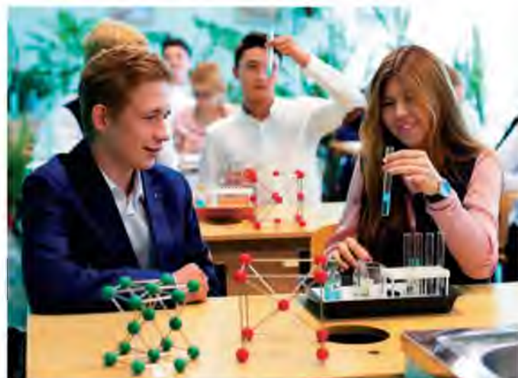
Ученикам инженерно-технических классов помогает глубоко изучать химию специальное оборудование, приобретённое Тольяттиазотом

В этом году среди девятиклассников гимназии №35 ОГЭ по химии сдают 23 человека, и,