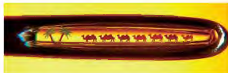
Миниатюра «Верблюды в игольном ушке»

Классическая музейная экспозиция рассказывает об истории нашего края и города с древнейших времен до начала XX века. Первые люди на нашей территории в эпоху камня, земледельцы и скотоводы «бронзового века», средневековое государство