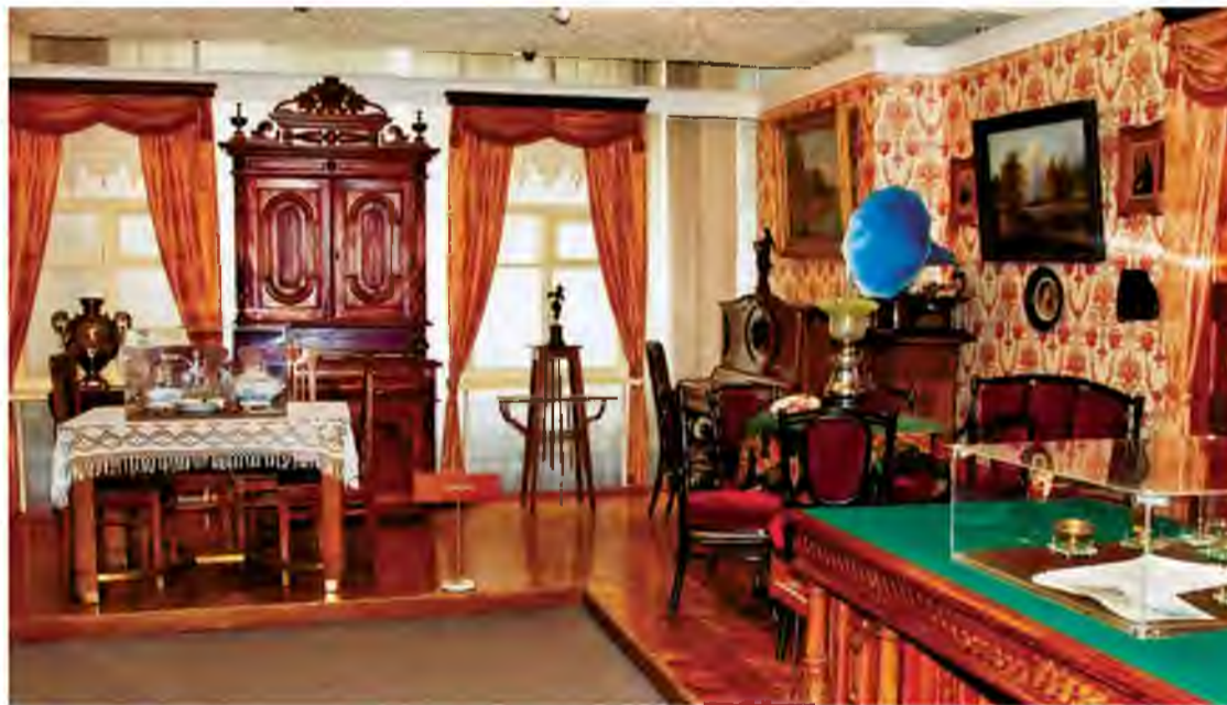
Экспозиция «Ставрополь провинциальный»

Выставка «Праздничный стол» рассказывает о традициях праздничного застолья в России в XX веке. Вы увидите потрясающий восьмиметровый стол, на кото-