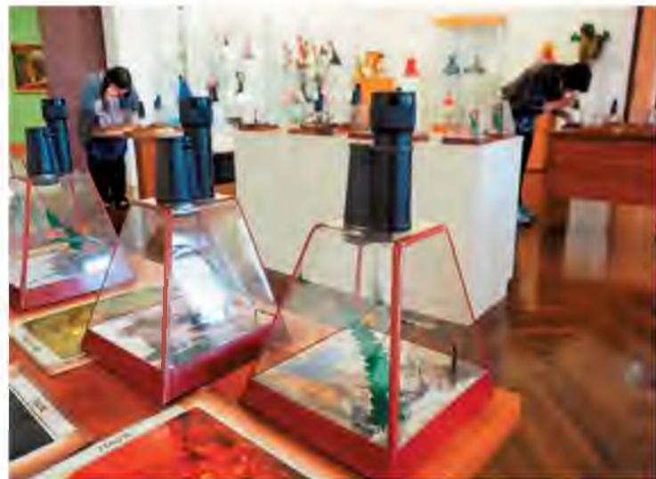
Мир под микроскопом

Краеведческий музей приглашает интересно провести время. В феврале его посетители ждут оригинальные экспонаты и интригующие истории. Для сотрудников Тольяттиазота и членов их семей в музее действуют льготные цены. Чтобы получить скидку, нужно предъявить в кассе заводской пропуск.